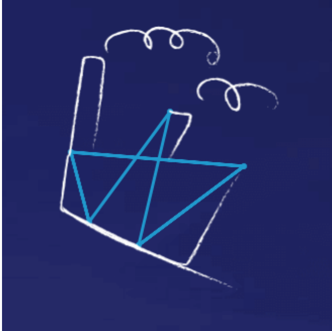
Grupa Enea została nowym właścicielem Elektrowni Połaniec

młodym, ambitnym studentom i absolwentom, którym zależy na zdobyciu unikalnego doświadczenia branżowego i rozwoju swoich umiejętności w obszarach biznesowych (m.in. techniczno-operacyjnym, administracyjno-prawnym, finansowo-księgowym, HR, IT oraz tradingowym). Po zakończeniu pierwszej edycji Zainstaluj się w Enei 70% stażystów otrzymało propozycję pracy w naszej Grupie. W kolejnej, drugiej edycji programu wzięło udział kolejnych 16 stażystów i praktykantów.