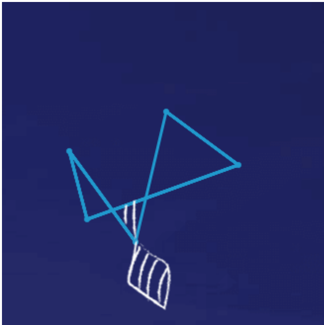
Program stażowy Zainstaluj się w Enei

W 2017 r. Grupa Enea zakończyła budowę i uruchomiła nowy blok energetyczny w Elektrowni Kozienice – blok B11 na parametry nadkrytyczne o mocy 1.075 MW. To najnowocześniejsza jednostka wytwórcza w kraju i największa w Europie opalana węglem kamiennym. Jednocześnie jest jedną z najsprawniejszych instalacji tego typu na świecie. Wzmacnia w ten sposób bezpieczeństwo energetyczne Polski. Wykorzystanie zaawansowanych rozwiązań technologii na parametry nadkrytyczne, pozwala na obniżenie emisji CO 2 o około 25% w stosunku do innych istniejących bloków opalanych węglem kamiennym.